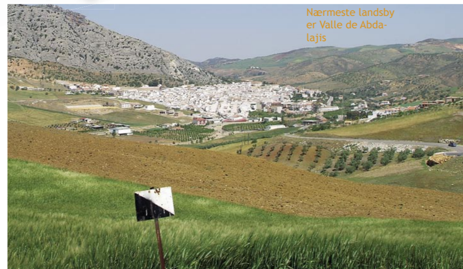
Nærmeste landsby er Valle de Abdalajis