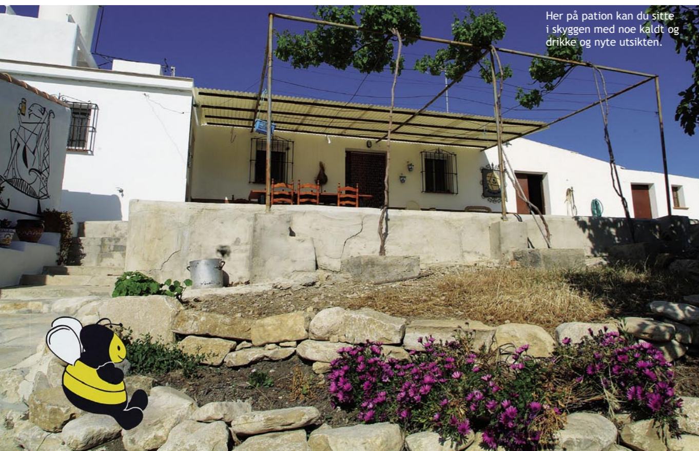
Her på patien kan du sitte i skyggen med noe kaldt og drikke og nyte utsikten.